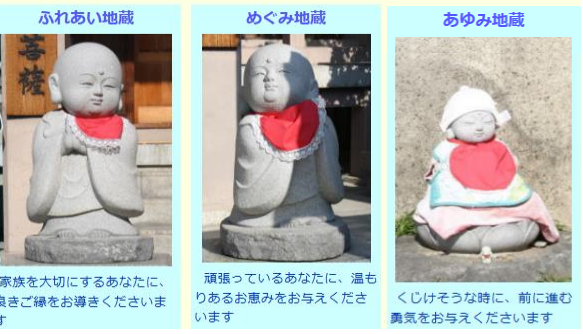
ぶれあい地藏 家族を大切にしているあなたに、良きご縁をお導きください